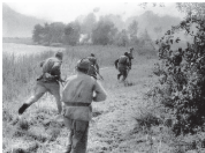
Автоматчики очищают берег озера от немцев на подступах к Восточной Пруссии. 1944 г.