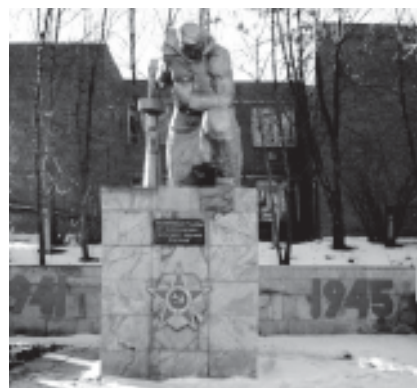
Памятник воинам, погибшим в годы Великой Отечественной войны. с. Шевырялово Сарапульского района.